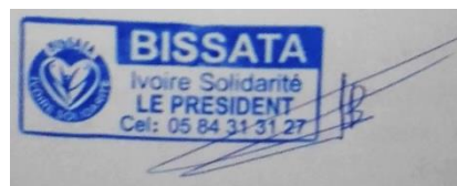
BADOU Koffi Fofié